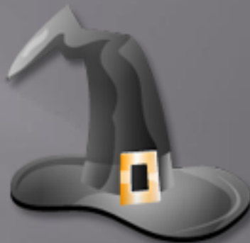
Witch's hat [wɪtʃ hæʔ]